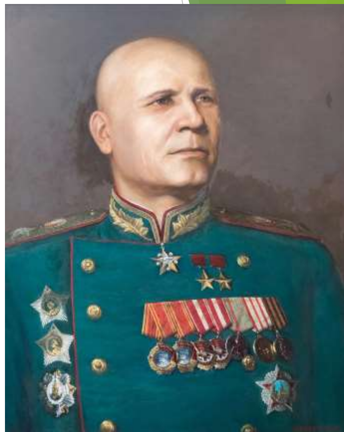
Конев И. С.

▶ В честь этого полководца Великой Отечественной войны, Маршала Советского Союза в городе Кирове построена площадь с памятником и названа улица. Он дважды герой Советского Союза.